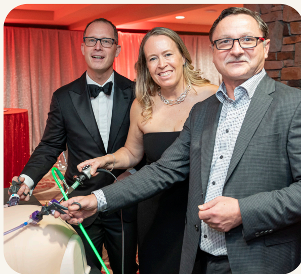
外科醫生展示未來手術器械

展望將來，Yurkovich家族大樓將擴大服務、提高效率、提升護理服務，為列治文的病人與家庭提供更好的護理服務。