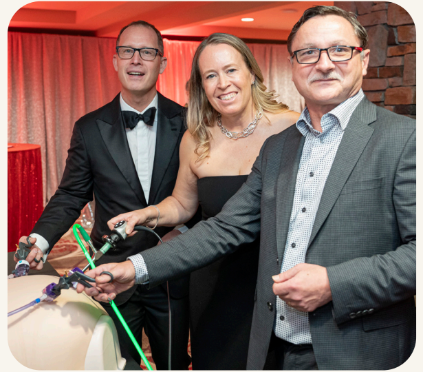
外科医生展示未来手术器械

展望未来，随着Yurkovich家族大楼落成，列治文的医疗服务将在可及性、效率及患者护理质量方面进一步提升，为社区家庭带来更安心、更优质的医疗保障。