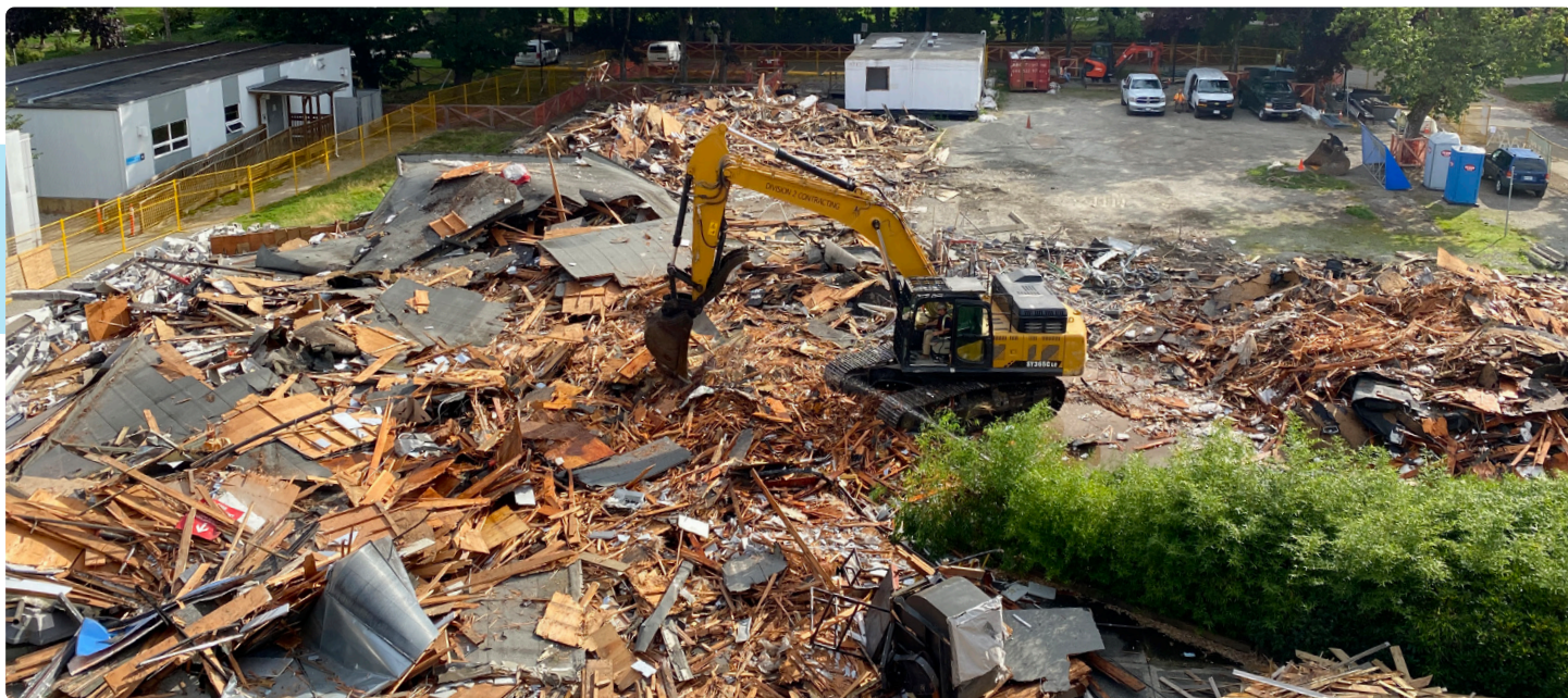
拆卸位於列治文醫院停車場旁的Rotunda大樓

今年夏天，列治文醫院重建項目取得重大進展 — 醫院的Rotunda大樓，即是本來的靜脈注射治療部、Noakes婦產科、兒科門診及卑詩大學(UBC)醫學院教學中心所在的建築，已被清空並且拆卸，為建造新的Yurkovich家族大樓鋪路。