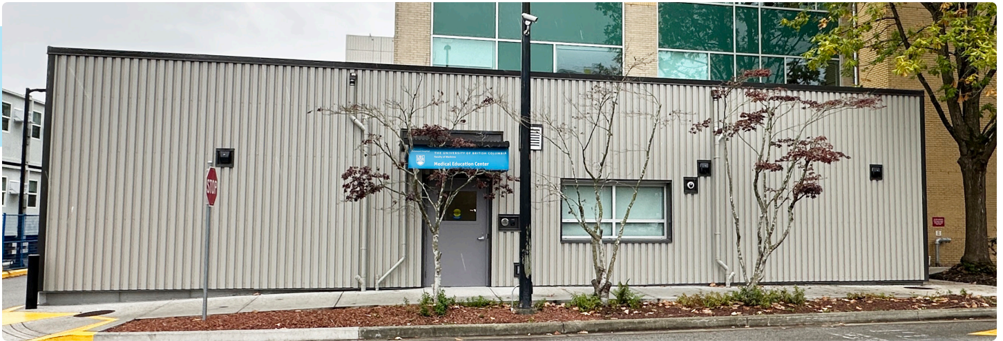
列治文醫院的新卑詩大學(UBC)醫學院教學中心

列治文醫院是卑詩大學(UBC)醫學院的臨床教學設施，為醫科學生、駐院醫生及研究人員提供綜合學習機會。新的卑詩大學醫學院教學中心最近在Milan Ilich大樓旁邊落成啟用，與醫院北大樓的教學空間功能互補，設有兩個研討室，以及一個配備齊全猶如模擬病房的臨床訓練室，讓學生熟習臨床技術。