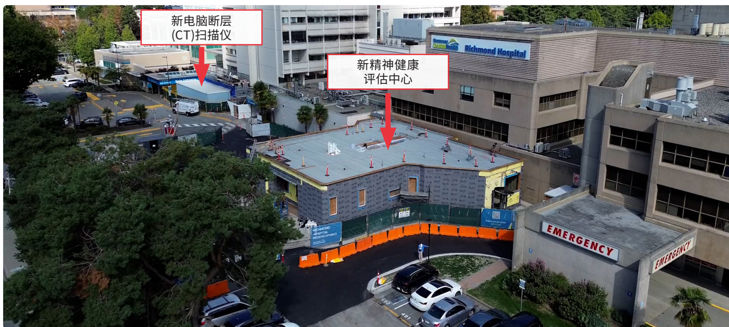
列治文医院现址视图